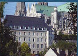
Hôtellerie Saint Yves